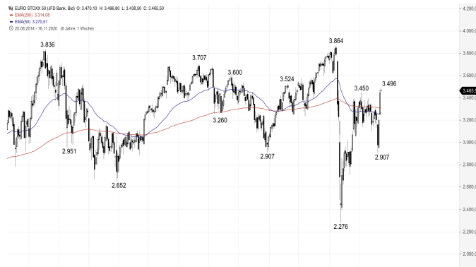
EuroStoxx 50 – 5-Jahres-Chart